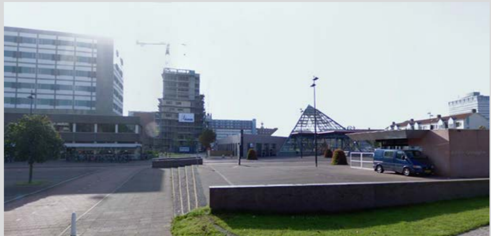
Pyramideplein in Rijswijk

Weleens op het Pyramideplein in Rijswijk geweest? Of er onderdoor gerold met de trein? Of erger nog, gestopt met de trein en vervolgens uitgestapt? Ik hoop van niet, het is een akelige ervaring. Het perron van station Rijswijk is het voorportaal van een wereld waar je niet wil zijn. Het perron heeft twee uitgangen: een aan de Churchilllaan en een aan het Pyramideplein. Welke uitgang je moet hebben, weet je natuurlijk niet als je er voor het eerst komt. Kies je de verkeerde uitgang, dan loopt het slecht met je af. Teruggaan naar beneden om de andere uitgang