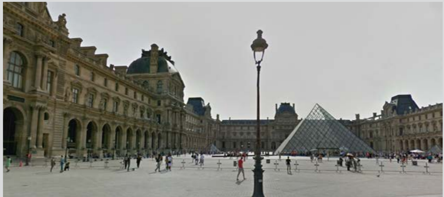
Place du Carroussel, Parijs, foto Googlemaps